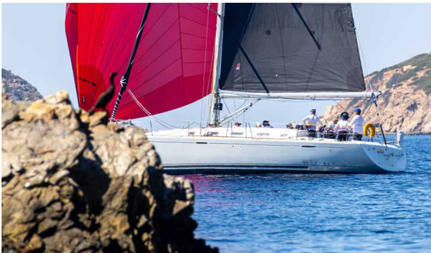
| Εικόνα 9: Συντελεστές TOD/TOT για αγώνες Σαρωνικού.