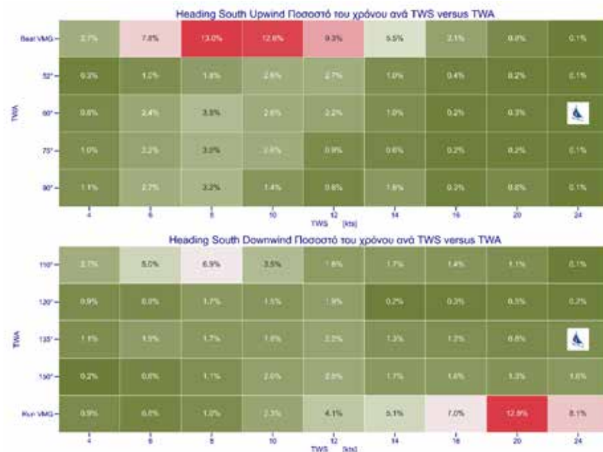
Εικόνα 8: Πιθανότητα ο άνεμος να φυσάει με ένταση TWA και διεύθυνση TWS, από το Φάληρο προς τα νότια, πλέοντας όρτσα (πάνω) και πρύμα (κάτω).

από τα νότια νησιά προς το Φάληρο, Εικόνα 9. Ο λόγος για δύο διαφορετικούς πίνακες, είναι ότι κατά την πρώτη διαδρομή όταν πλεύουμε πρύμα έχουμε βόρειους ανέμους και όταν πλεύουμε όρτσα, νότιους. Αντίθετα όταν επιστρέφουμε. Οι βόρειοι και νότιοι άνεμοι έχουν διαφορετικά χαρακτηριστικά, ένταση και διεύθυνση.