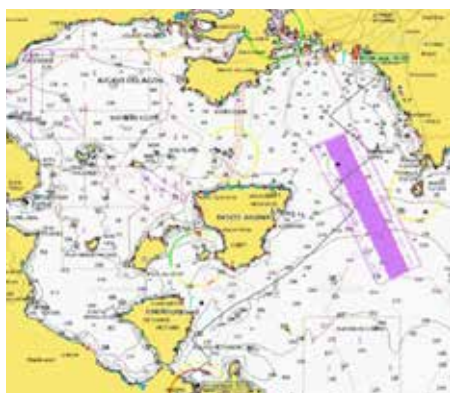
Εικόνα 3: Βέλτιστη διαδρομή από τον Πόρο στο Φάληρο με τον βορριά να κυριαρχεί.

As υποθέσουμε ότι τρέχουμε ένα αγώνα από το Φάληρο στον Πόρο, κάποια μέρα τον Μάιο ή τον Σεπτέμβριο. Εκκίνηση 10:30, τερματισμός, όταν τερματίσουμε ανάλογα με το τι αέρα έχει! Το αγωνιστικό πρόγραμμα έχει πολλούς αγώνες στον Σαρωνικό κάθε Μάιο και Σεπτέμβριο. Χρησιμοποιώντας τις προβλέψεις του καιρού για αυτή την ημέρα, και γνωρίζοντας τις πολικές ενός σκάφους, είναι δυνατόν να υπολογίσουμε τη βέλτιστη διαδρομή από την εκκίνηση μέχρι τον τερματισμό, Εικόνα 3 . Για τις προβλέψεις του καιρού χρησιμοποιούμε αρχεία grib του μετεωρολογικού μοντέλου WRF-4Km 2 , γιατί έχει το μικρότερο χρονικών διαστημάτων, εδώ επιλέξαμε και την ένταση του αέρα σε περιοχές ανά 4 x 4 χιλιόμετρα, καλύπτοντας όλη την περιοχή του αγώνα. Φυσικά είναι αδύνατον να έχουμε ανάλογα πραγματικά δεδομένα, και αναγκαστικά επαφίομαστε στις προβλέψεις. Έχοντας τα αρχεία grib για την ημέρα του αγώνα, και τις πολικές του σκάφους, υπολογίζουμε τη βέλτιστη διαδρομή με την εφαρμογή qTvm. Η βέλτιστη διαδρομή αποτελείται από ένα σύνολο χρονικών διαστημάτων, εδώ επιλέξαμε 20 λεπτά, κατά τη διάρκεια των οποίων για το καθένα, έχουμε τη διεύθυνση TWD, την ταχύτητα TWS, και τη γωνία με την πορεία μας, του πραγματικού ανέμου, TWA, βλέπε Εικόνα 4 .