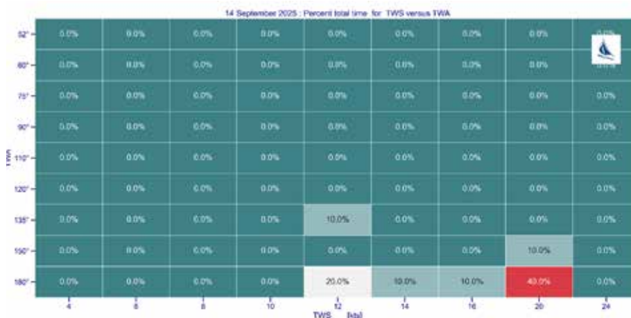
Εικόνα 5: Ποσοστά χρόνου ανά TWS/TWA κατά τον αγώνα της 14 ης Σεπτεμβρίου.

Σεπτεμβρίου 2025 είμαστε σχεδόν πύμα και η ταχύτητα του αέρα ήταν από 12 έως 20 κόμβους. Σαράντα τις εκατό (40%) του χρόνου ταξιδέψαμε κατάπρυμα και η ένταση του αέρα ήταν 20 κόμβοι. Κλασικός βοριάς.