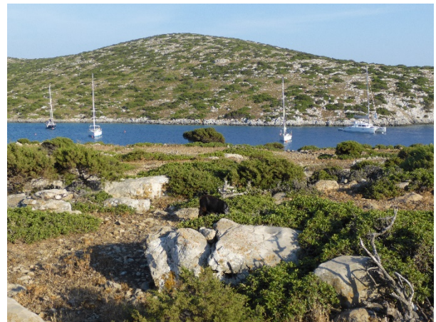
Αροδου στα Λεβιθα

Όμως είναι η ιστιοπλοΐα μόνο άθλημα réservée για αθλητές και σε μιαν ελίτ που ξέρει ; Άλλες μέρες άλλο τοπίο. Αρχές Ιουνίου πρωί πρωί, μόλις άνοιξε ο Βασιλόπουλος, γεμίζουμε 3 καρτόνια τρόφιμα, νερά, μια μπουκάλα ούζο, Βαρβαγιάννη πράσινο, ενθύμιο της θητείας μου στη Μυτιλήνη. Μια μπουκάλα κρασί ψαροσύρικο από την Κύθνο μας έχει μείνει από πέρσι. Να μην το ξεχνάμε, το πλήρωμα είναι Γάλλοι. Σύρος, Δονούσα, Λέβιθα, Αστυπάλαια, Σύμη, Ρόδος, Καστελόριζο, Νότια Τουρκία στην χώρα των Λυκίων και των Καρίων. Ιωνία και Κνίδος, επιστροφή στην Ελλάδα, το Ικάριο με πλάγιο άνεμο με καμπόσο μελτέμι, πάλι η Σύρος, το στέκι μας, πίσω στο λιμανάκι μας, Φάληρο. Πέντε βδομάδες, 4 άτομα, σε ένα σκάφος 10,5 μ, 950 μίλια. Συνθήκες λίγο καλλίτερες από τα νεανικά μας camping , μέσα στην σκόνη της διψασμένης γης. Δεν αγωνιζόμαστε κανέναν, κανείς δεν μας κυνηγάει, χαλαρά, περνάμε τον χρόνο μας σε ένα τουρκικό καφενείο, στο Buzburun , απέναντι από την Σύμη, παρακολουθώντας μια παρτίδα τάβλι, οι πούλιες κάνουν τον ίδιο θόρυβο με τις δικές μας.