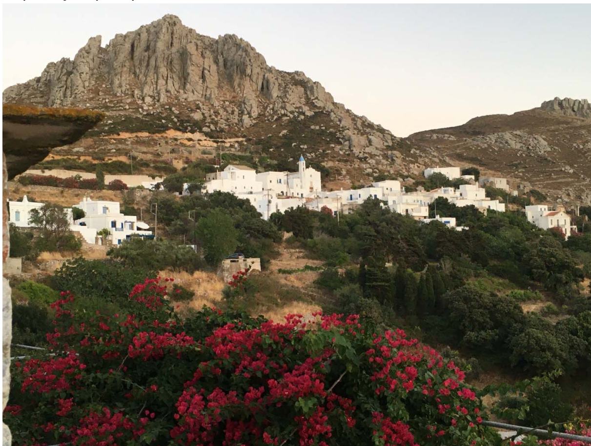
Τήνος, το ορεινό χωριό Κουμαρος

Όπως αναμενότανε περάσαμε τελευταίοι την πόρτα της Κύθνου, τον Άγιο Δημήτριο, μετά από μια δύσκολη νύχτα με άπνοια και συντροφία τον πονεμένο Σαν Τζώρτζη. Μετά την Κύθνο άπνοια τελείως. Σαν να είχαμε φουντάρει επι τόπου !!! Αδύνατον να φτάσουμε στην Τήνο πριν τις 9μμ που ήταν το όριο του χρόνου μας. Χωρίς μιλά διασταυρώνουμε τα βλέμματα μας και με μια δόση ενοχής, γυρίζουμε το κλειδί της μίζας, Πλώρη για τον Φοίνικα στην Σύρο, σπίτι μου, αρόδου, με το σιδερένιο πανί. Την επόμενη μέρα που ο αέρας φόρτωσε λίγο, πάμε Τήνο, με τα πανιά! Μας καλωσορίζει μια κυρία που μας ψάχνει από χτες να μας δώσει μια μπουκάλα κρασί ! Το βράδυ, απονομή βραβείων, σε ένα καταπληκτικό κτήμα, σε ένα από τα φημισμένα ορεινά χωριά. Ο πρώτος στην κατηγορία performance, ο πρώτος στην κατηγορία sport, και μεγαλύτερος σε ηλικία από όλους μας και κατά πολύ, αλλά τίποτα στον μοναδικό που τερμάτισε πρώτος στην Σύρο !!!